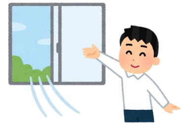
窓を開けて、空気も気持ちもリフレッシュ!

なお今後の状況次第では、大幅に開催の予定が変更になる場合もありますので、ご了承ください。